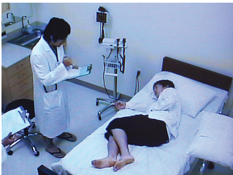
模擬患者を相手にMedical Interview